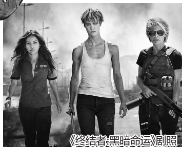
《终结者：黑暗命运》剧照