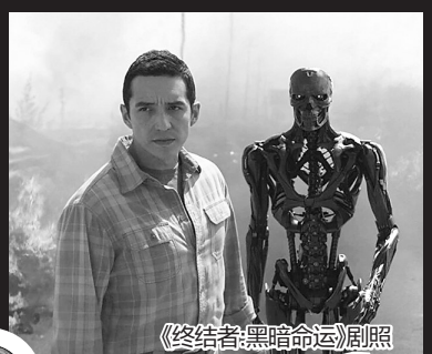
《终结者：黑暗命运》剧照