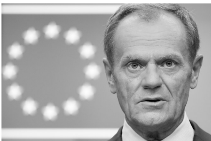
10月17日，在布鲁塞尔，欧洲理事会主席图斯克出席新闻发布会。资料图片

即将卸任的欧洲理事会主席唐纳德·图斯克警告，脱离欧洲联盟后，英国在国际事务中的影响力将下降，成为“二等国家”。