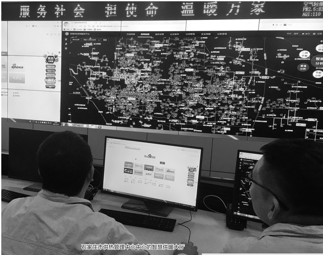
石家庄市供热管理中心中心的智慧供暖大厅

省会供热管理中心相关负责人表示,不管是老旧小区改造还是其它原因造成的家中不热的,居民都应该第一时间跟供热企业或者物业联系,让他们查清不热的具体原因。如果是大故障造成的热网不热,期望居民耐心等待一下,所有的保障队伍都在抢修。如果邻居都热了就自家不热,自己可以采取一些放气等措施。如果还是不热可以跟物业公司或者热企联系。如果物业或者供热企业仍然无法解决可以拨打区供热办和区长供热热线12319,石家庄市供热管理部门会第一时间要求区供热办和供热企业为居民解决问题。