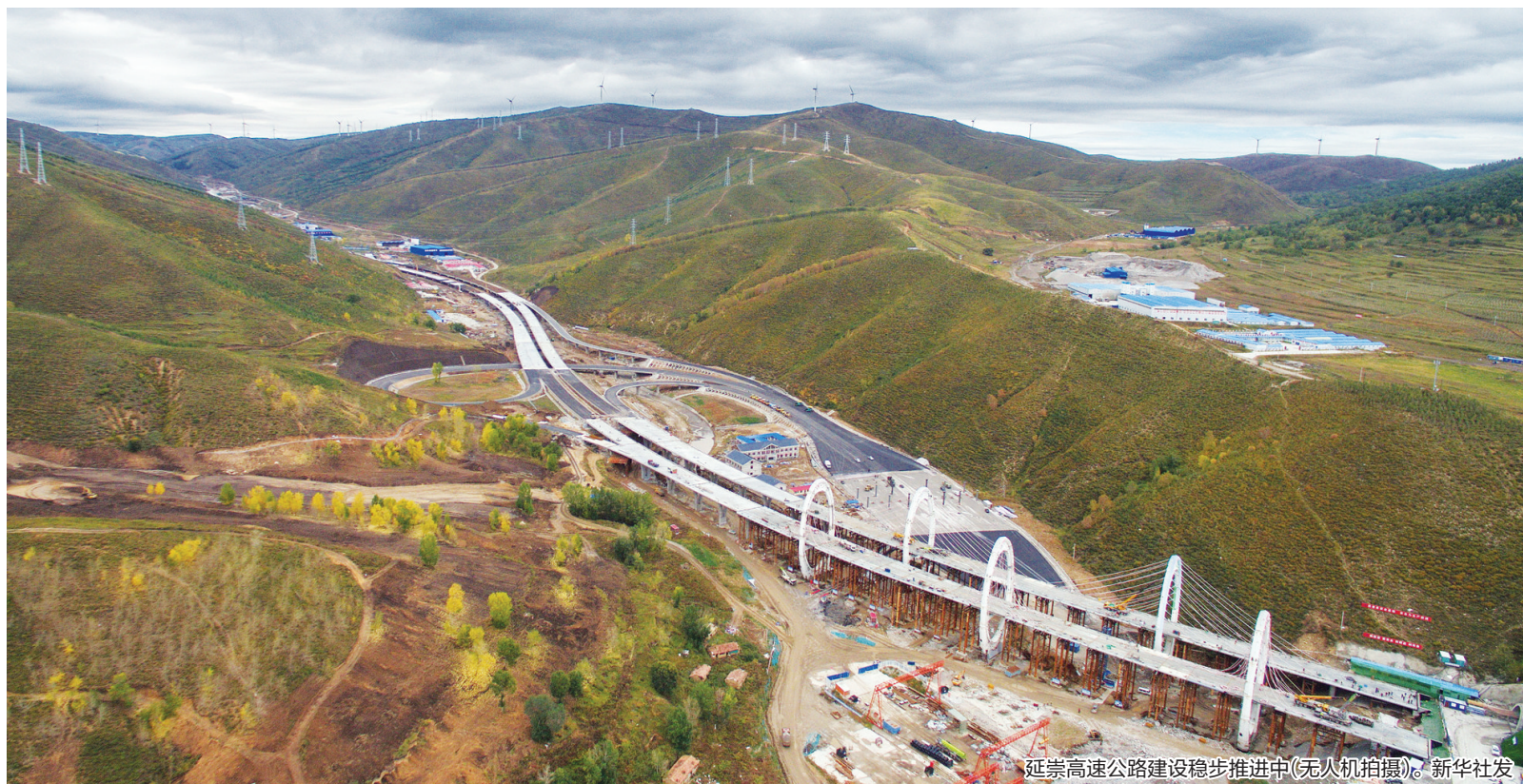
延崇高速公路建设稳步推进中(无人机拍摄)。