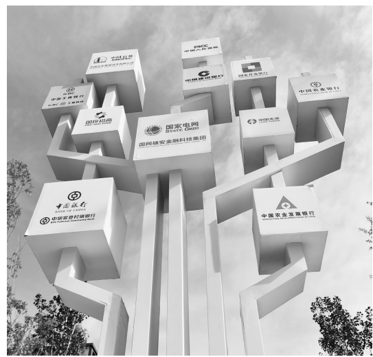
雄安市民中心附近,矗立着树状的企业标志牌。资料图片

我省20项民心工程有序实施,棚户区改造开工4.35万套,老旧小区改造工程开工率达到88%,公共文化服务工程完成年度任务的96%;居民收入平稳增长,城镇、农村居民人均可支配收入分别比上年同期加快0.5个和0.3个百分点。