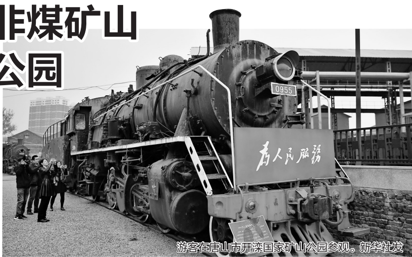
游客在唐山市开滦国家矿山公园参观。