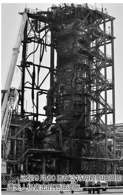
这是9月20日在沙特胡赖斯拍摄的遭无人机袭击的石油设施。