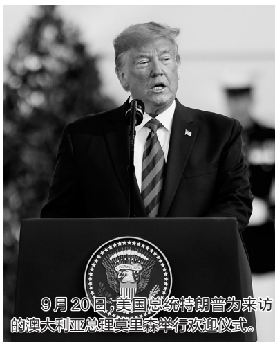
9月20日，美国总统特朗普为来访的澳大利亚总理莫里森举行欢迎仪式。