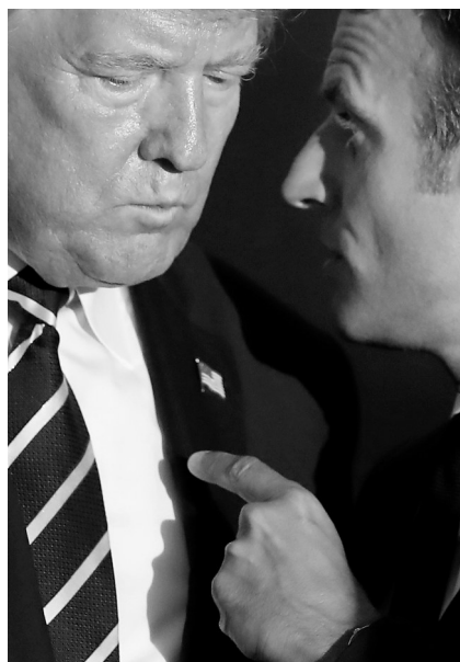
8月25日，法国总统马克龙(右)与美国总统特朗普在参加合影时交谈。