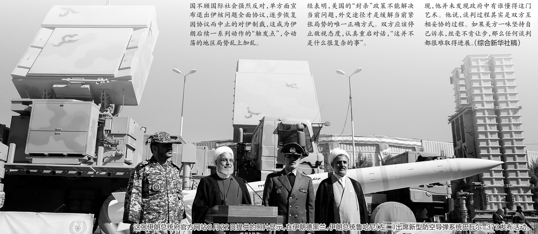
这张伊朗总统府官方网站8月22日提供的照片显示，在伊朗德黑兰，伊朗总统鲁哈尼(左二)出席新型防空导弹系统巴瓦尔-373发布活动。

伊朗曾进行过数次航天发射活动。美国认为运载火箭与弹道导弹技术相通，多次表示反对伊朗进行卫星发射活动。