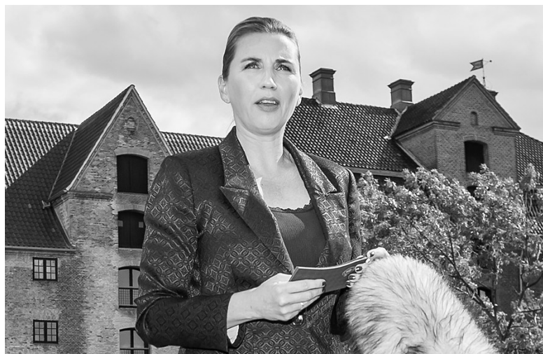
8月21日,在丹麦首都哥本哈根,丹麦首相弗雷泽里克森在获悉美国总统特朗普决定推迟访问丹麦后对媒体讲话。