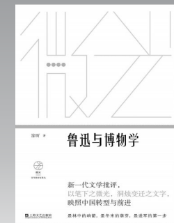
《鲁迅与博物学》 涂昕著，上海文艺出版社

梁晓声先生解读《聊斋志异》的文化随笔新作。书中，作者不仅仅从《聊斋志异》的文本特点、艺术价值、人物及故事特色等方面进行评析，更是从这部作品隐约显露的文字和内容线索中，透析出当时中国社会的百样情态和正史讳谈的历史真相，摹画中国人尤其是中国文人的悲喜哀愁、在人性与道德之间纠结与碰撞，以及埋藏在他们内心最深处的欲望。可以说是一部从微观视角切入，品评中国文化特点极富意趣而又有人文关怀和思考深度的作品。