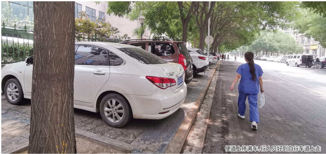
便道上停满车,行人只好到自行车道上走

石家庄市第五医院西侧的仓兴街,有200多米长的便道每天都停放着大量机动车辆,行人只好到自行车道上行走。