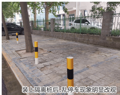
装设隔离桩后,乱停车现象明显改观

记者也看到,的确有一些车辆上面落满了灰尘。此外,就在距离不远的地方便设有停车场。