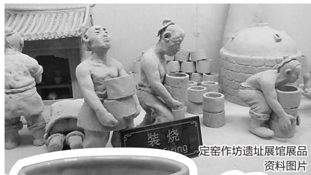
定窑作坊遗址展馆展品