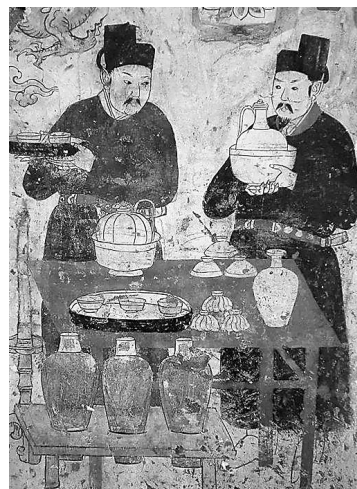
辽代壁画

令人欣喜的是，2001年井陘窑遗址被公布为第五批全国重点文物保护单位，井陘窑又重新回到人们的视线中，跻身河北“四大古窑”之列。由井陘窑烧制的宋代白瓷枕、天威军官瓶俨然成了收藏界热烈追捧的新宠。