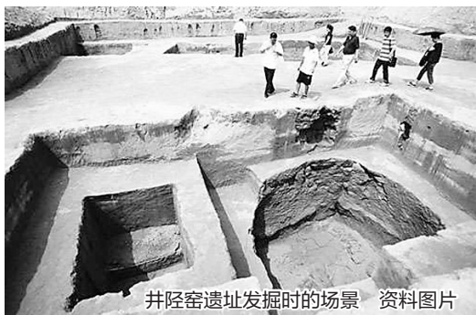
井陘窑遗址发掘时的场景 资料图片