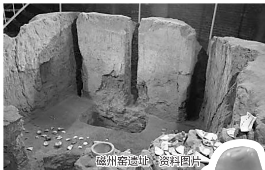
磁州窑遗址