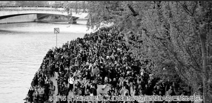
4月15日,在法国巴黎,人们在塞纳河边遥望起火的巴黎圣母院。