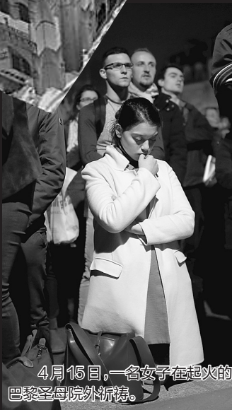
4月15日,一名女子在起火的巴黎圣母院外流涕。