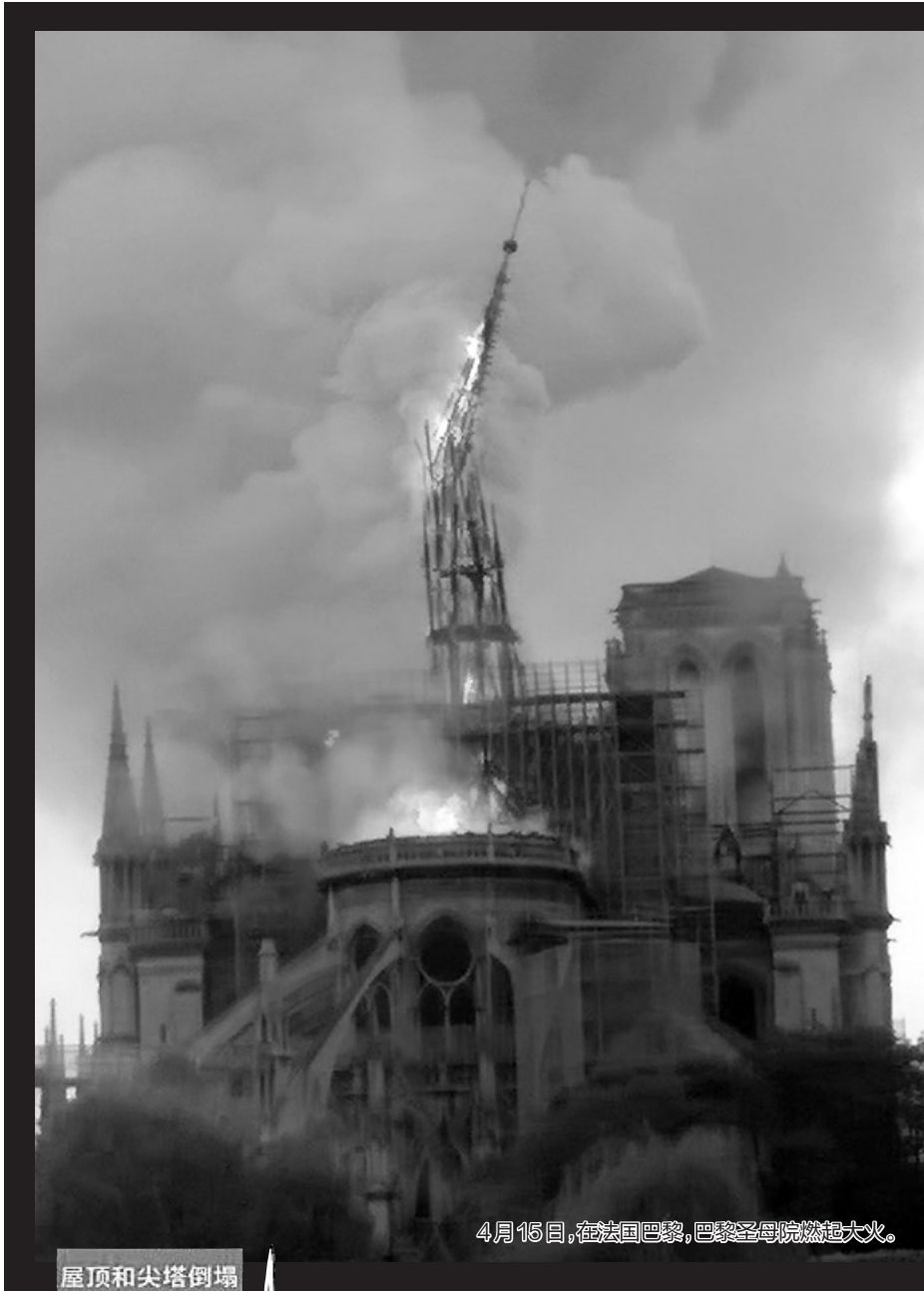
4月15日,在法国巴黎,巴黎圣母院燃起大火。

巴黎检察机关15日晚说,正着手调查这场大火的原因。多名警方消息人士说,初步推断火灾是意外。据多家法国媒体报道,圣母院顶楼的电线短路可能是引发火灾的原因。 火灾发生时,巴黎圣母院正处于维修状态,可以看到搭建好的脚手架。巴黎市长安妮·伊达尔戈介绍,由于维修施工,巴黎圣母院内部分艺术品早就被转移走,多座铜像被移除,得以逃过大火。