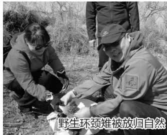
野生环颈雉被放归自然