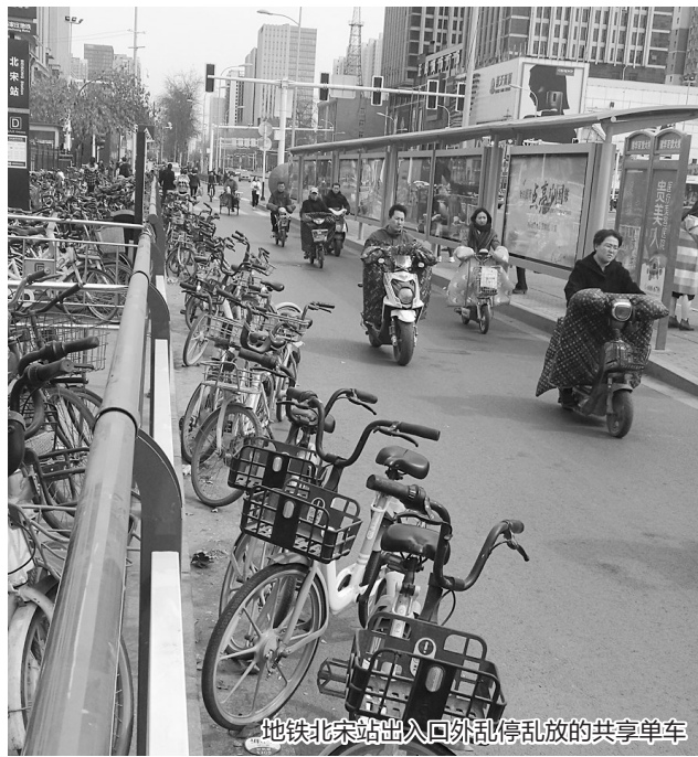
地铁北宋站出入口外乱停乱放的共享单车