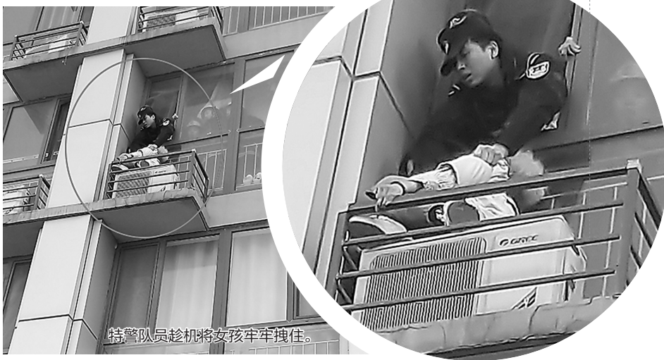
特警队员趁机将女孩牢牢拽住。