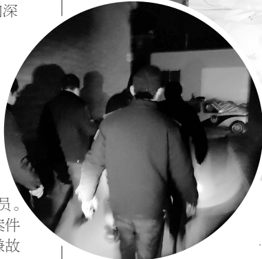
◀火速出击抓捕犯罪嫌疑人。