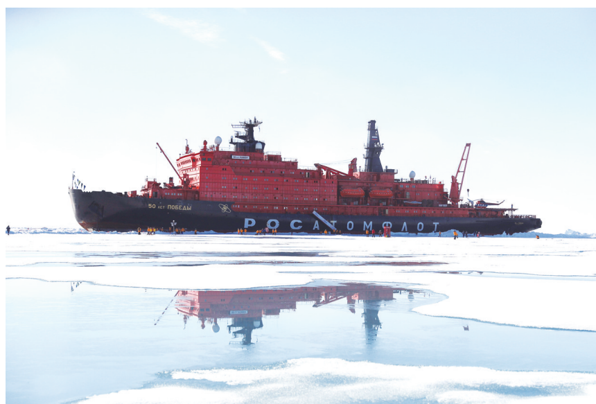
俄罗斯核动力破冰船开到北极点。