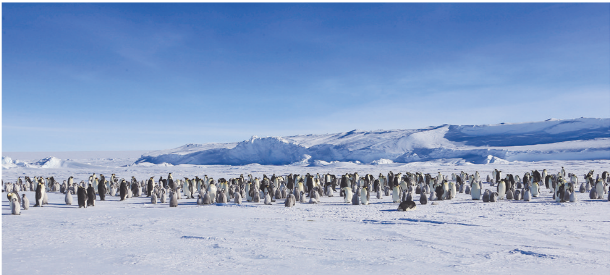
南极帝企鹅栖息地