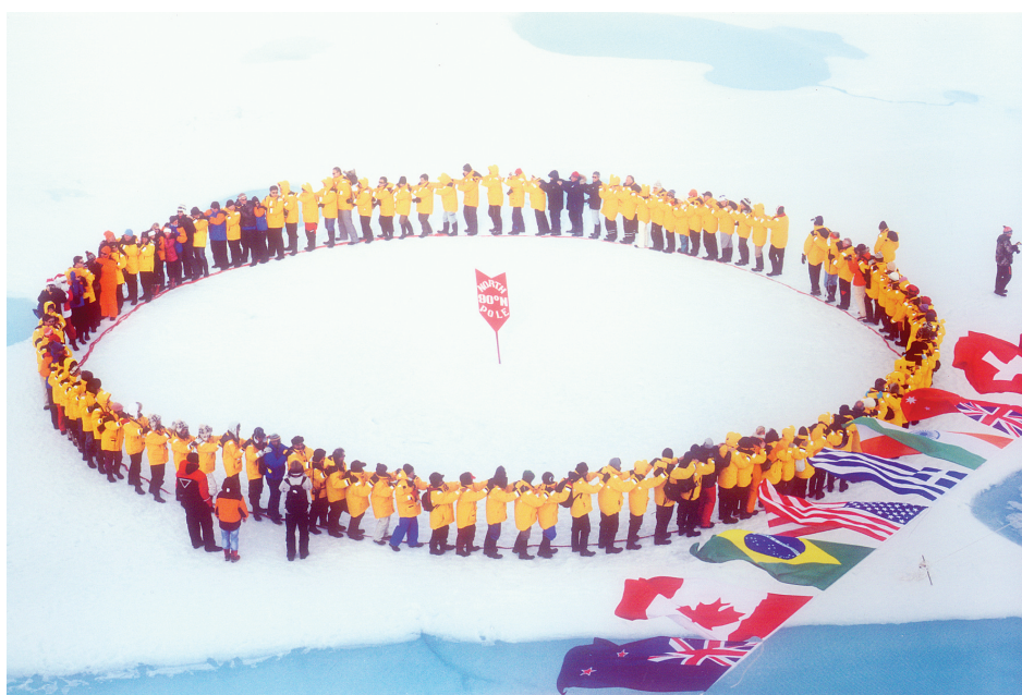
北极点：绕地球一圈