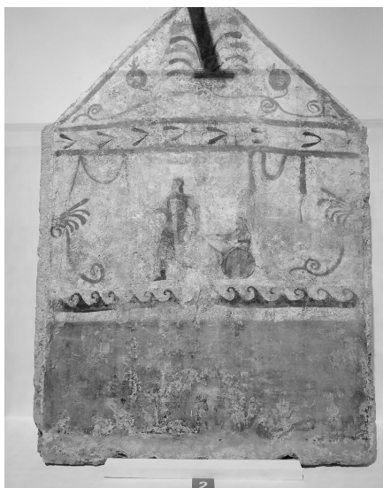
“战士归来”主题壁画

据帕埃斯图姆考古遗址公园的馆长加布里埃尔·楚赫特里格介绍,这是帕埃斯图姆专题展览首次走出欧洲,河北是在中国巡展的首站。本次展览展出的帕埃斯图姆考古遗址公园珍藏的134件(套)精美文物,在中国大陆都是首次亮相。