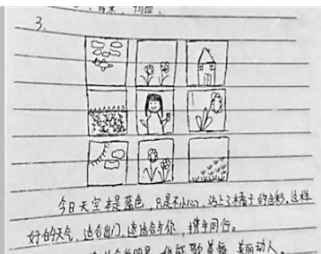
学生答“帮杜丽娘‘发朋友圈’”。