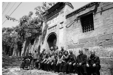
文天平拍摄的李梅花村