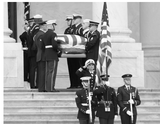
12月5日,美国前总统乔治·赫伯特·沃克·布什的灵柩离开国会大厦。

内政上,老布什的表现却不尽如人意。里根执政时期遗留下来的巨额国债,使老布什面临要么削减开支要么加税的艰难选择。在民主党掌控的国会施压下,老布什最终违背竞选承诺选择了加税,结果其支持率受到重创。与此同时,美国经济陷入低迷,失业率高企,进一步刺激了美国民众的不满情绪。在1992年总统选举中,不少选民认为老布什热衷于国际事务,而