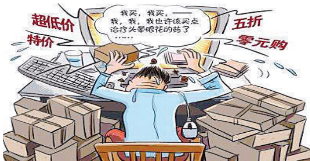
受访者最爱囤日用百货、服装鞋帽和母婴用品

不少人在“双11”购物节趁便宜囤很多东西,之后很长时间都用不完。囤积的物品不仅占用了家中空间,降低生活舒适度,过了保质期还会造成浪费。