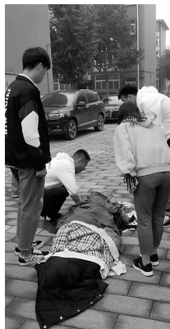
老人被救出火场后,同学们将自己的衣服脱下给老人保暖。

据了解,天天正能量是阿里巴巴集团旗下公益开放平台,联合燕赵都市报等主流媒体在全国范围寻找真善美、奖励正能量。截至2018年9月,天天正能量总计投入公益金4800多万元,发起每周正能量常规评选260期、特别策划奖励600多次,直接奖励人数超过5000人。本报推荐的多位新闻人物获得正能量奖励。