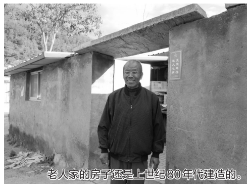
老人家的房子还是上世纪80年代建造的。