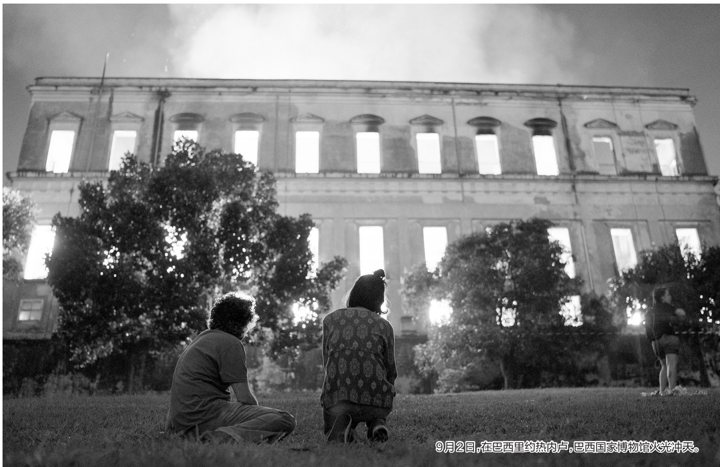
9月2日，在巴西里约热内卢，巴西国家博物馆火光冲天。

巴西国家博物馆目前由里约联邦大学管理，除作为科研机构外，还是自然历史博物馆，同时展出王室的一些生活物品，馆内2000万件藏品展现了从1500年葡萄牙人发现巴西一直到巴西成立共和国的历史。