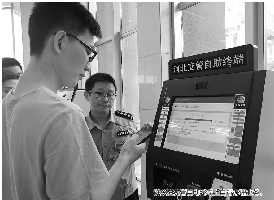
群众在交管自助终端上自行办理业务。

日前,记者从省交管局了解到,公安部20项交通管理“放管服”改革新措施正式出台后,迅速引起了社会的广泛关注。8月1日起,“四个减免、一证即办、一窗通办、自助快办”等8项先期便民惠民服务措施在石家庄、廊坊、保定三市正式落地实行。