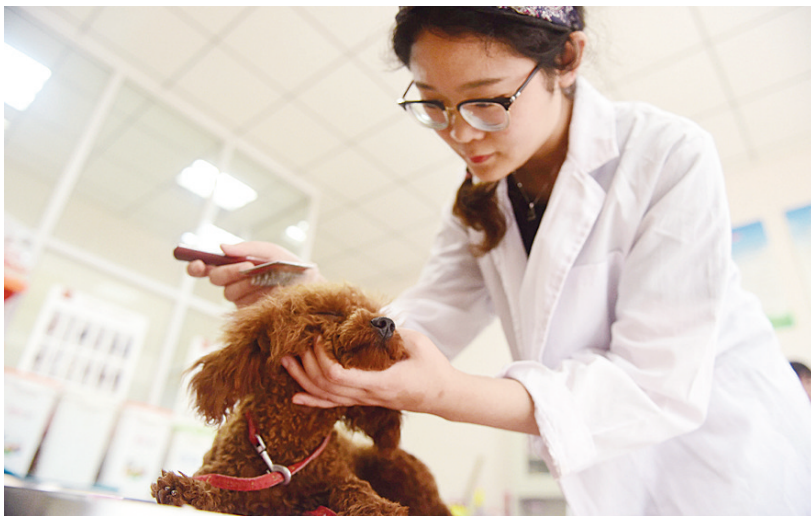
梳理宠物的毛,小狗很享受的样子。