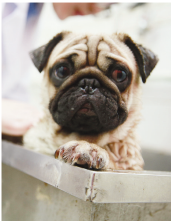
“马上就可以洗澡了!”