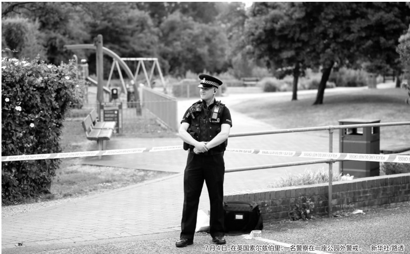
7月4日,在英国索尔兹伯里,一名警察在一座公园外警戒。

今年3月4日,斯科里帕尔及其女儿在索尔兹伯里市街头一张长椅上昏迷不醒。英国警方说,两人中了神经毒剂。英国政府称俄罗斯“极有可能”与此事有关。俄方对此坚决否认,认为英国的指控意在抹黑俄罗斯。斯科里帕尔及其女儿经过救治已先后出院。“中毒”事件引发英国、美国等西方国家及其盟友、伙伴与俄罗斯相互驱逐外交官,人数为“冷战”1991年结束以来最多。