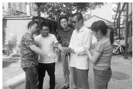
邢台老乡会一行赶来相助