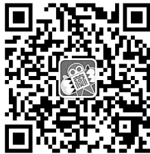
▲系列招聘活动具体安排可到本报官方微信查询

其中,3月5日、6日、12日、13日、19日、20日、26日、27日,石家庄市人力资源市场一楼大厅(槐安西路48号)将举办8场“春风行动”专场招聘会,用人单位须提供营业执照副本原件、单位介绍信、工作人员身份证办理招聘手续;求职者须携带本人身份证进行招聘登记。咨询电话:89631820、89631821、89631822。此外,参加县(市、区)招聘直接拨打县(市、区)联系电话或拨打89631863。