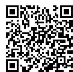
该二维码7天内(2月6日前)有效,重新进入将更新