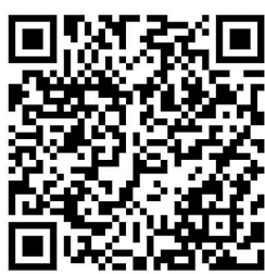
该二维码7天内(2月6日前)有效,重新进入将更新