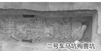
二号车马坑殉兽坑