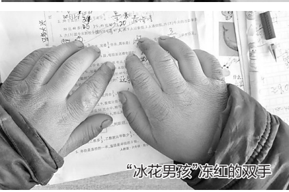
“冰花男孩”冻红的双手