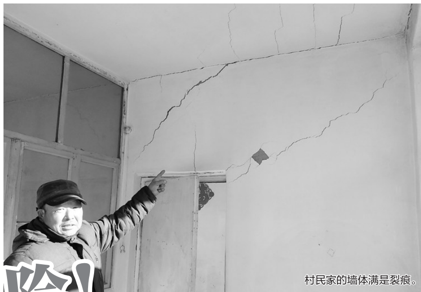
村民家的墙体满是裂痕。