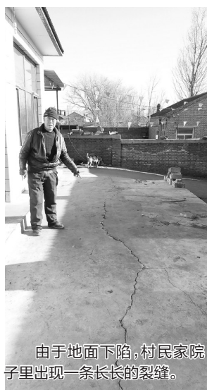
由于地面下陷，村民家院子里出现一条长长的裂缝。