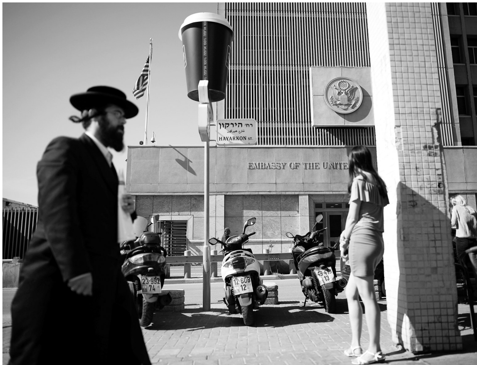
▲12月5日,特朗普在白宫对记者讲话。▲这是2017年1月20日拍摄的位于特拉维夫的美国驻以色列使馆的资料照片。

据美国官员当地时间5日晚间透露,美国总统特朗普计划于6日宣布承认耶路撒冷为以色列首都,并将责令美国国务院启动美驻以使馆从特拉维夫迁至耶路撒冷的进程。