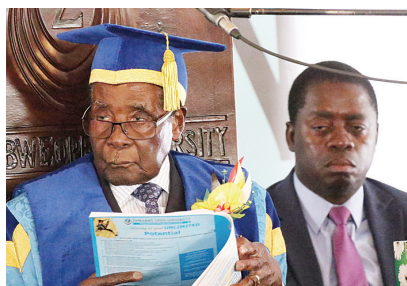
17日,在津巴布韦首都哈拉雷的津巴布韦开放大学,总统穆加贝(左)主持毕业典礼。

津巴布韦军方15日凌晨采取军事行动,全面控制政府要害部门并通过国家电视台发表声明,否认发动军事政变,表示将确保总统