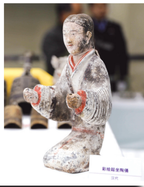
这是被追回的汉代彩绘陶俑。

新华社电(记者白阳、陈晨)记者17日获悉,陕西警方近日在公安部的组织指挥下,破获了公安部挂牌督办的淳化“7·20”系列盗掘西汉古墓案,1100余件涉案文物被追回。这是今年全国公安机关打击文物犯罪专项行动取得的又一重大战果。