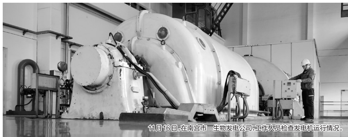
11月16日,在南宫市一生物发电公司,工作人员检查发电机运行情况。

近日,南宫市迎来了供暖季,当地使用秸秆等生物质发电过程中产生的余热,经过热循环装置、真空水循环系统和地下管道,将热量输送到城区1.6万多户居民家中,秸秆回收利用成为这个城市供暖的新热源。据了解,当地利用秸秆等生物质发电及供热,年可节约标准煤10万吨。