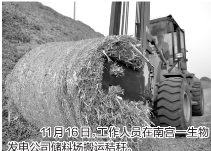
11月16日,工作人员在南宫一生物发电公司储料场搬运秸秆。