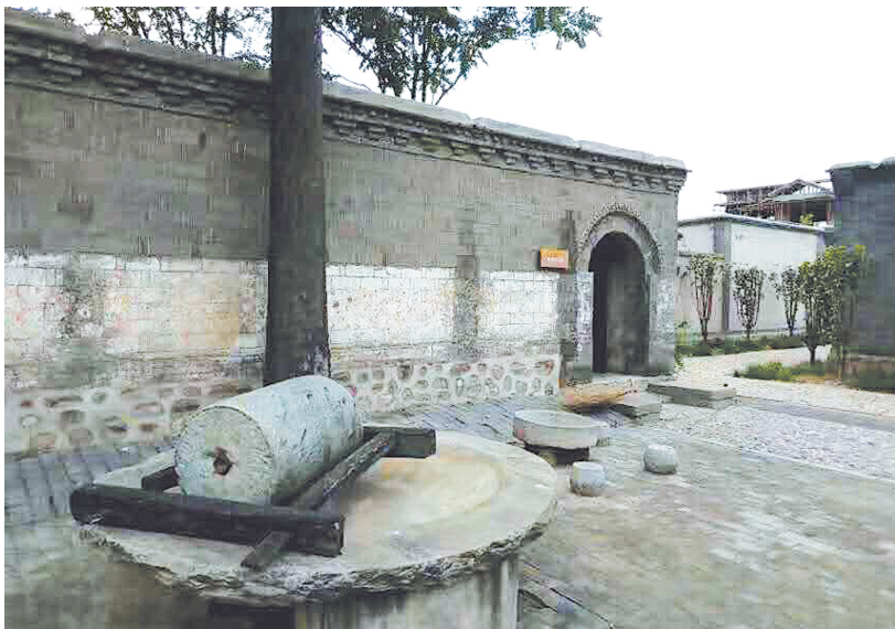
平山里庄村《人民日报》创刊旧址