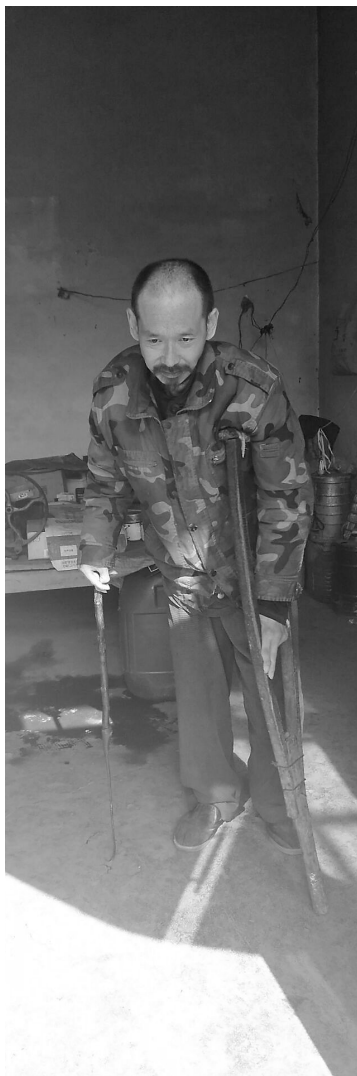
朱同义六七年没出门了