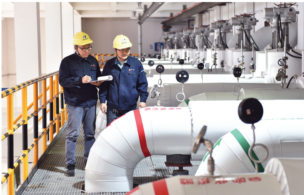
▲11月1日,石家庄华电供热集团有限公司裕西隔压站的技术人员正在巡查试运行中的换热器运行状况。

昨日,记者了解到,全市供热准备工作已基本完成,部分“气改水”“串改并”及二次管网改造等工程正在进行收尾,将确保11月5日前完成。所有供热企业将于11月8日带热试运行。