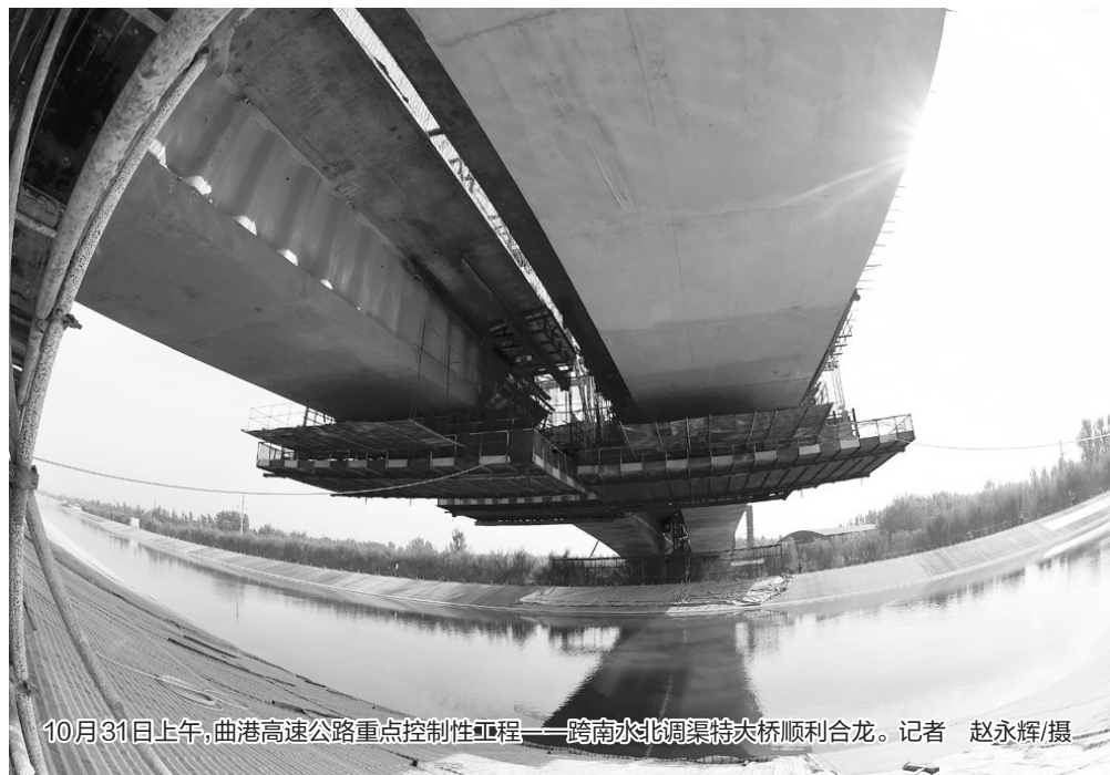
10月31日上午,曲港高速公路重点控制性工程——跨南水北调渠特大桥梁顺利合龙。