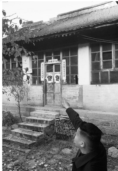
白求恩故居房顶年久失修已部分坍塌