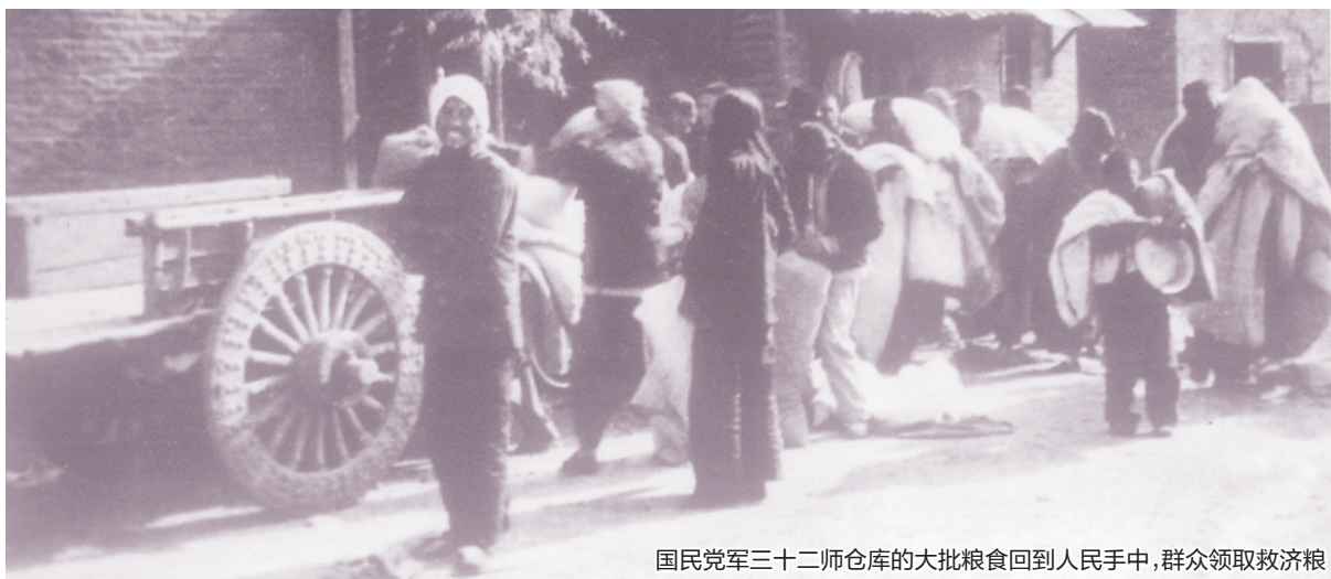
国民党军三十二师仓库的大批粮食回到人民手中,群众领取救济粮