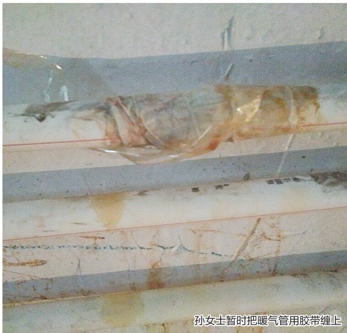
孙女士暂时把暖气管用胶带缠上

本报热线：88620000 本报官方微博：@燕赵都市报 本报官方微信：yzdsbwx