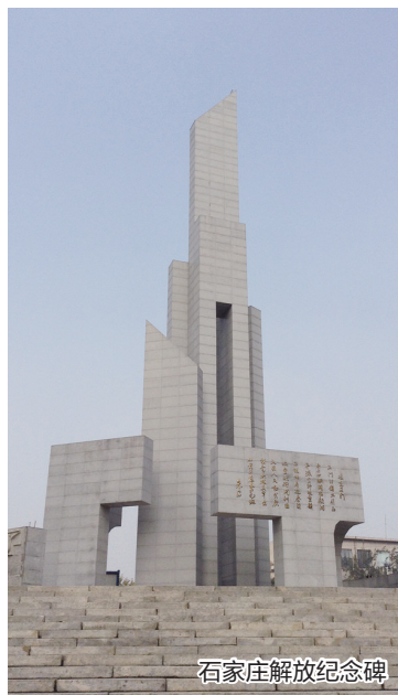
石家庄解放纪念碑