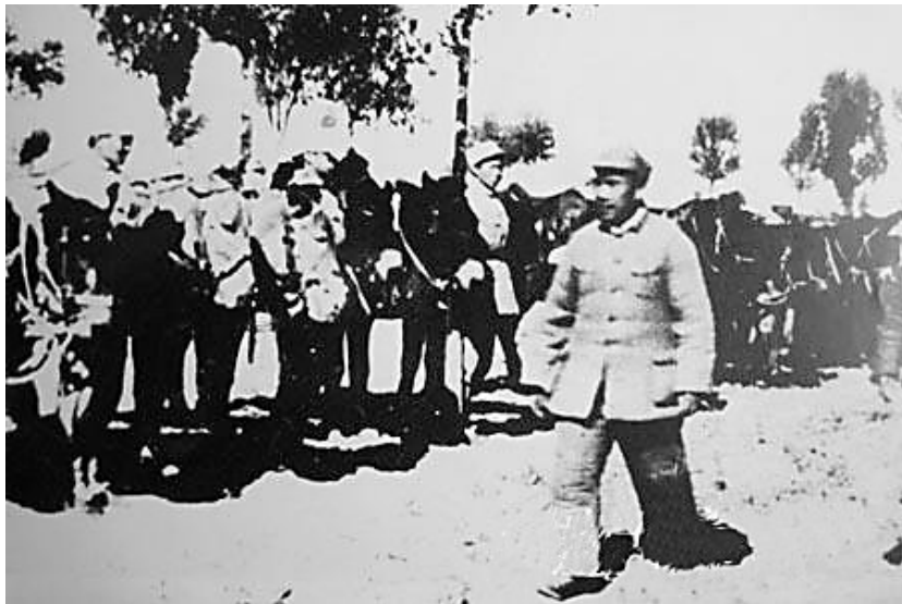
朱德在石家庄战役前夕检阅炮兵