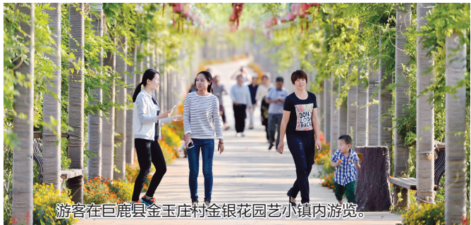
游客在巨鹿县金玉庄村金银花园艺小镇内游览。

业内认为,如果对民宿小规模、多层次、个性化的特点把握不足而只是简单地按照酒店行业标准“一刀切”,容易出现行业政策“水土不服”的现象。由于部分地区按照酒店式消防、安全等标准对民宿进行管理,使得很多房东处于“办不了证”又“不甘心关门”的矛盾心理中,实际上仍维持无证经营的状态。在中国旅游研究院院长戴斌看来,政府对分享住宿的管理应本着谨慎开放的原则,稳步推进住宿分享经济发展。