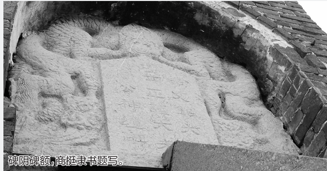
碑阴碑额，商挺隶书题写。