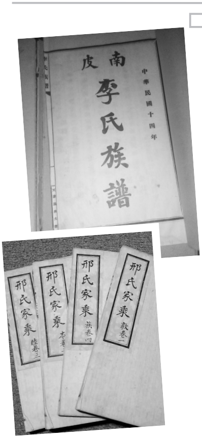
有助于追根求源寻根问祖

近年来随着寻根热的兴起与家族文化观念的重新复兴,收藏旧家谱,修纂新家谱又蔚然成风,这是非常可喜的社会现象。“历史不能隔断”,忘记过去即意味着背叛,国家如此,个人亦如是。家谱作为一个家族演变发展的脉络根源载体,与国史、县志相辅相成,互为经纬,成为我国历史文化遗产不可分割的一部分。