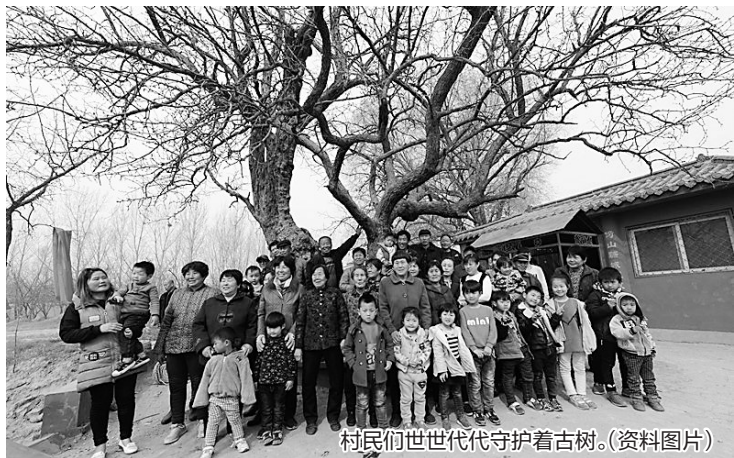
村民们世世代代守护着古树。(资料图片)

邯郸市涉县固新镇古槐树、石家庄市灵寿县车谷坨山茶树、唐山市滦县青龙山银杏、承德市丰宁满族自治县九龙松、承德市平泉县九龙蟠杨、保定市阜平周家河古柏、秦皇岛市海港区石门寨银杏、邢台市邢台县前南峪板栗王、沧州市河间姚天宫村枣树、衡水市枣强县一棵松。