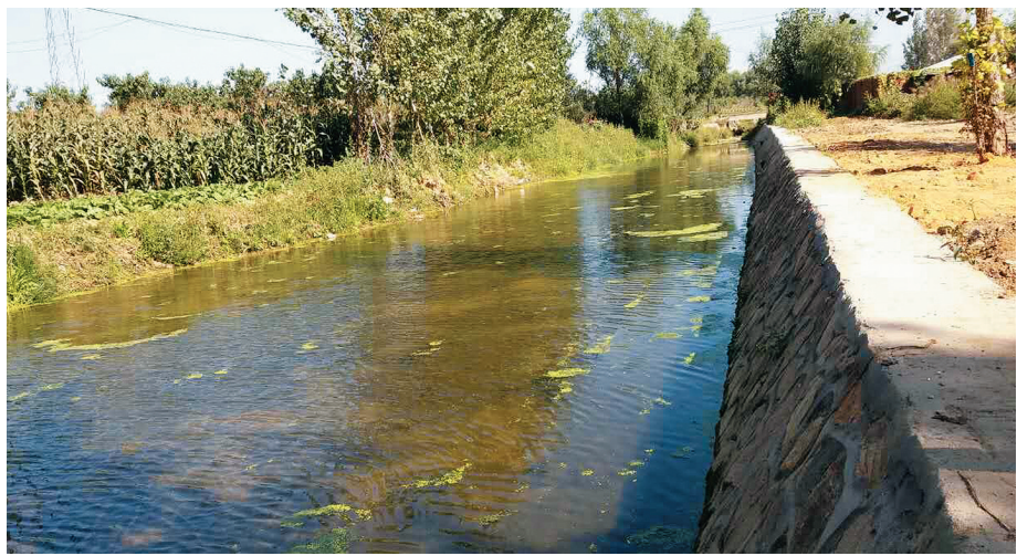
大汤河新华村支流北张庄段河道新貌