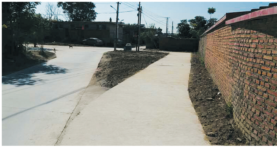
泄洪渠改造成暗渠安装了排水系统