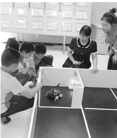
三名少年演示获奖机器人项目“灭火”